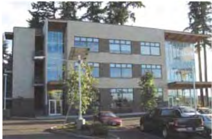
El Edificio Viridian de RTJ Partnership en Portland, OR, obtuvo una certificación LEED Versión 2.0 el 11 de Diciembre de 2001.

Con el incremento en beneficios privados y públicos que se derivan para los edificios sostenibles de alta rentabilidad, los promotores pueden ser elegibles para incentivos financieros y reguladores aún mayores. New York, Maryland, Massachusetts y Oregon están a la cabeza de los estados que ofrecen incentivos fiscales a los edificios certificados LEED. Portland (OR) y Seattle (WA) ofrecen subvenciones para los costes relacionados con la modelización energética y revisiones de puesta en marcha. El Fondo privado Green Building Loan Fund de Pittsburgh hace lo mismo en base a préstamos. Arlington County (VA) asocia incrementos de edificabilidad a edificios LEED. Santa Barbara (CA) y Scottsdale (AZ) son algunas de las primeras jurisdicciones en ofrecer revisiones rápidas a los permisos y licencias para edificios con ciertas características de alta eficiencia. Mientras tanto, la Kresge Foundation, proveedor de €120 millones en subvenciones innovadoras para inversiones en edificios en 2000, está lanzando en su cartera una iniciativa para apoyar el proyecto, la planificación y la asesoría en formación para edificios certificados LEED.